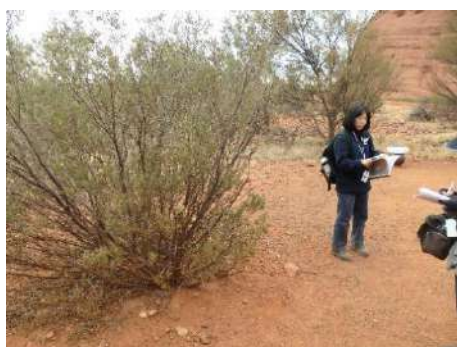
（灌木の根元に生育）

昆虫や蟻も貴重な食材であった。ウイチティグラブはヤガやコウモリガの幼虫で灌木の根の周りに生息して、 生食か灰の中で蒸し焼きにして食べる。