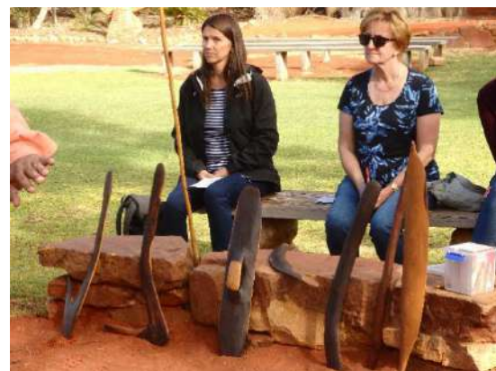
(狩の道具 カーリー)

増えすぎて害獣扱いのカンガルーの肉は、スーパーマーケットで牛肉と並んで販売され、レストランでも提供されている。牛肉と食べ比べると少し筋が多いが、たんぱくな味であって臭みは感じられず黙って出されたら牛肉と区別がつかない。