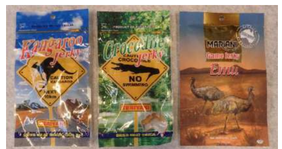
(カンガルー・クロコダイル・エミューのジャーキー)