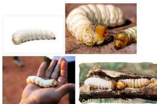
（ウイチティグラブ）

Mulga Tree（マルガツリー）という木の下には、Honey Ant（ハニーアント）という花の蜜を体内に蓄えるアリの巣がある。 地中から掘り起こし蜜の部分をおやつ代わりに食べていた。